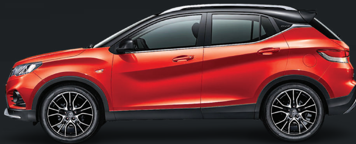
Rojo - techo negro