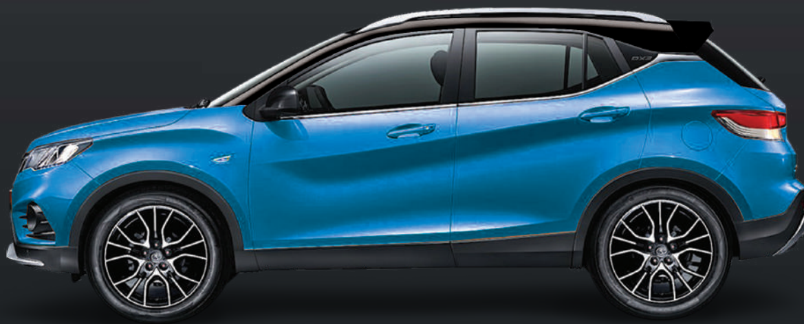
Azul - techo negro